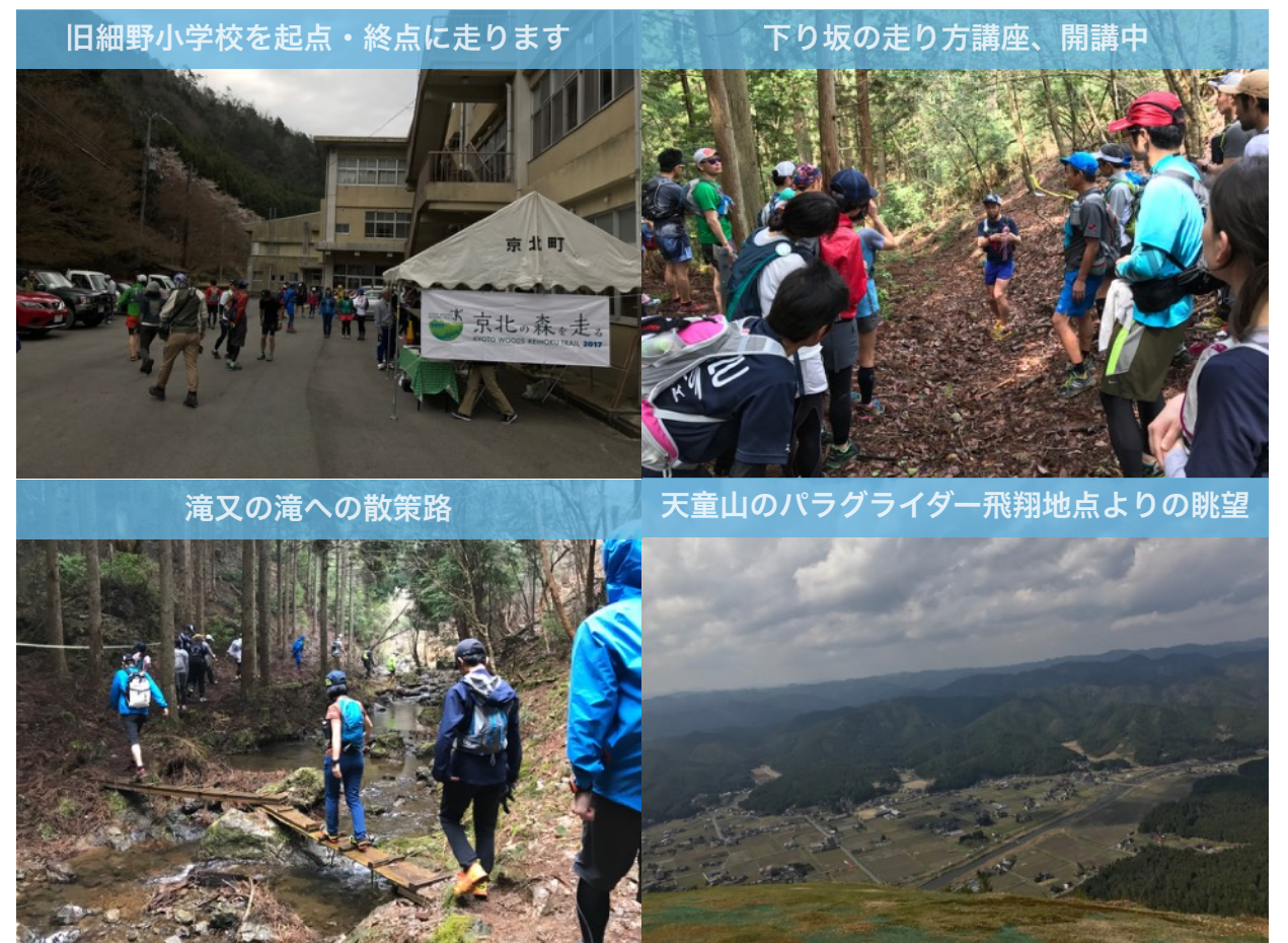
旧細野小学校を起点・終点に走ります

折しも桜の満開時期を迎えていたことから、「京都市街からそう離れていないところにこんなに桜が綺麗な場所があったなんて驚き。来年は花見もしてみたい」「丁寧に整備された京北トレイルコースの走りやすさに感動。大阪ではこんなに手入れされた山はなく、プライベートでも走りに来てみたい」「早く11月の本大会で思い切り走りたい」という嬉しい反応がありました。また、あうる京北での懇親会BBQ、羽田酒造さんの地酒試飲も大好評。大会関係者も上々の反応に手応えを感じており、打ち合わせも熱を帯びています。11月の本大会にご期待ください！！