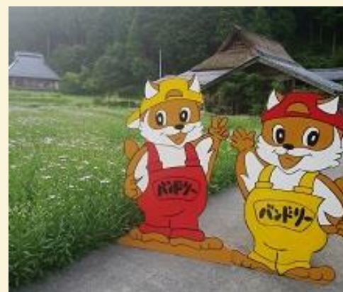
久多オリジナルキャラクター「バンドリー君（双子）」と、咲き始めた北山友禅菊。