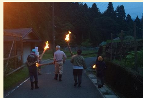
松明を持ち「泥虫出ていけ～、刺し虫もでていけ～」と、太鼓と鉦に合わせて歌い歩く。

7月15日（土）に行われた、「虫送り」に参加させていただきました。「虫送り」は、この季節に発生する「害虫」を川下の方へ送る行事です。松明を手に持ち、太鼓と鉦の音に合わせて、「出ていけ、出ていけ、泥虫出ていけ。刺し虫も出ていけ。あとはすいーと、すいーとせえ」と、子どもも大人も唄を歌い、不思議な一体感に包まれて行進します。街中ではまず見られないこの行事。揺れる火をみながらの行進は、室町時代にタイムスリップしたように感じました。来年も好天に恵まれますように。