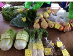
花脊の皆さんに提供していただいた野菜約20種類→