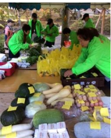
↑自治会の皆さんもたくさん参加