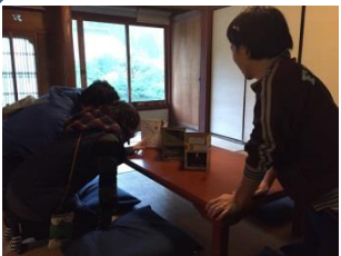
↑外は荒れ模様ですが、中はまったり

当日は別所で二十三回目となる『別所井戸端展』が開催されており、台風にも関わらず来られたお客様は出店された皆様の家でゆっくりと過ごされたようです。