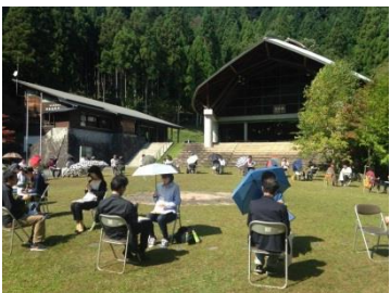
↓日傘をさしても暑い一日でした

で今年はなんと八組ものカップルが誕生しました！移住先は、この北部山間地域にと、しっかりと宣伝もさせていただきまし