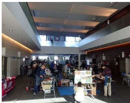
サンサDEクリスマスマーケット(12月10日)

「越畑DAY」京都学園大学太秦キャンパス(今回は、「越畑DAY」ですが、嵯原からの出品もあります。来年度は、「宕陰DAY」となります。農業ビジネスセンター京都打合せ、宕陰活性化実行委員会、地域おこし協力隊及び集落支援員研修(東京)、京都市地域連携型空き家対策促進事業情報交換会。