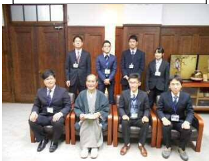
右京区地域支え合い活動入門講座