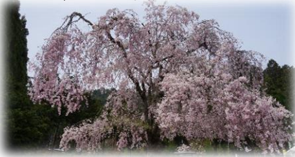
↑常照皇寺の寺門前