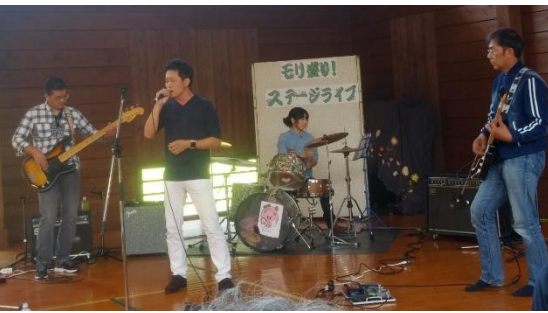
↑京北のロックバンドでドラムを演奏♪

10月27日、黒田ふれあいまつりが行われました。今年では25周年で規模を拡大し、野菜収穫体験、地区外からの出店、木工体験、黒田の写真展、黒田のキャラクター「ひゃくらちゃん」のワークショップなど特別企画も盛りだくさん！私はステージ企画、進行、自分も出演とバタバタと駆け回っていました！たくさんの方にお越しいただきとても楽しく、大成功のおまつりとなりました☆☆☆