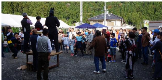
↑フィナーレ餅まきは奪い合い(笑)