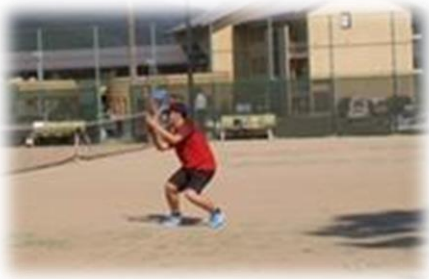
テニスに勤しむ著者(8月上旬) *20年ぶりに再開しました

以前より叔父から「野菜の栽培をしてみないか」と勧められておりましたので、移住を機に叔父のビニールハウスの一角を借り受けて野菜栽培を始めました。長期的には米以外の野菜は自給で賄えればと考えています(初めての栽培であるため、収量はいまひとつでしたが・・・秋冬は根菜類の煮物で晩酌を楽しむ予定)。