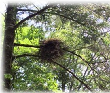
オオタカの巣です