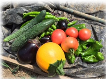
土と水が良く、農薬要らずでおいしい野菜ができます。食べ物を考えるよい機会にもなりました。