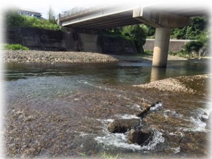
思い出の宝庫 上桂川。夏休みに従兄弟と川遊びや魚釣りを楽しみました。人生初の友釣りを体験したのも上桂川です。