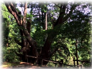
こちらの台杉は何と樹齢800年とか