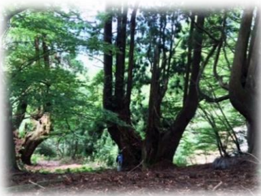
画像では見づらいますが、人と杉の対比です。ぜひご体験を！

黒田地区には片波川源流域という森林があり、伏条台杉群が存在します。生まれて初めての伏条台杉群生地の視察に同行しました。よく手入れされた散策路を進むと、人の営みと自然の織り成す芸術にただただ圧倒されるばかり。何と樹齢八百年という古杉もあります。屋久杉よりも感動的だと言われることもあるのだとか。 また、オオタカ等の希少動物が棲む森でもあります。森をあとにし、いつかこの森のガイドができるようになりたいと考えている自分が居ました。