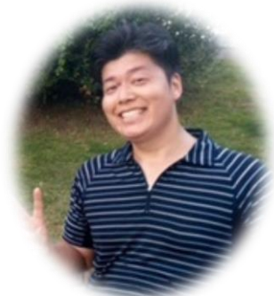
ジョギング後、鴨川にて

京北において、野生動物と遭遇するのは日常的な光景ですが、私の住まいは周山の住宅地。それなりに人の多い場所ながら、先日住まいのすぐそばで二ホンザルを見かけました。過去にはアライグマとも遭遇(飼えなくなった外来種を京北の山林へ捨てに来るけしからん輩がいるそうです)しておりますし、熊と出会うのも遠い将来ではなさそうな気がしてきました。