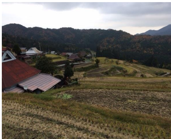
グループの方たちと滋賀県高島市の畑というところに農家民宿の研修にいつてきました。棚田百選にもえらばれている素晴らしい棚田でしたが、やはり後継者不足には悩まされているそうです。

ら少し来れば豊かな自然に触れられる…それが浸透するように、かがやき隊としても農家民宿を応援していきたいと思います！