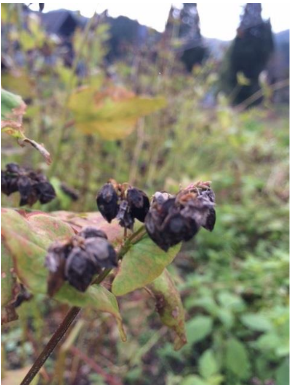
↑別所OKUきょうとネットで育てている蕎麦を収穫しました。

で暮らしている方々も共感できるかと思ひます。自然の中で暮らすと当然大変なこともありますが、それ以上食べ物、景色、人の優しさ…たくさん喜びに感ずれる事ができると感ずっています。