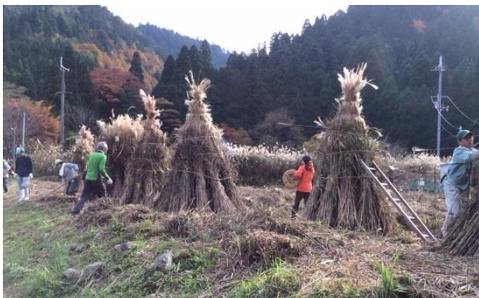
先日久多で行われたカヤ刈りの様子。たくさんのボランティアと住民が参加しました。