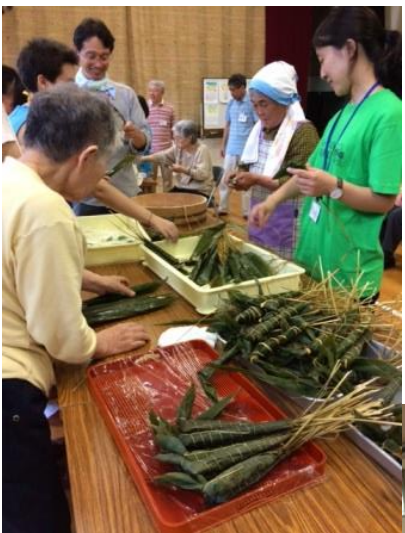
大切な機会でした。

七月八日、別所の世代間交流イベントに参加させていただきました。去年かがやき隊として就任したばかりの頃に声をかけて頂き、初めて参加した個人的にも思い出深いイベントです。今年も、ちまき作り等を通して赤ちゃんからお年寄りまで幅広い世代の皆さんが交流をしました。子供達はお年寄りに教わりながらちまき巻き。苦戦して出来上がったちまきを食べると、年齢なんて関係なく皆につこりと嬉しそうでした。技術や味と共に昔の記憶や想いを受け継