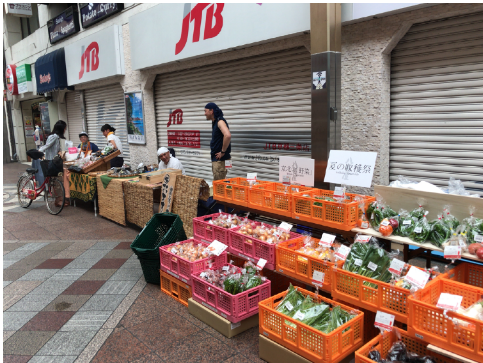
この場所では滋賀県の高島市の皆様も販売ブースを設置しておられます。和菓子（お餅）や有機野菜・鯖寿司の販売をされていますよ。また、以前は美山町の皆様が野菜の販売をされていたそうです。

下京区の【崇仁新町】と同様、これをきっかけに京北産野菜のファンを増やしていけるように売り場に立ちます！毎週火曜日の午前中に販売（但し、作況によってはお休みがあるかもしれません。その際はご容赦ください）しますので、お近くにお越しの際はぜひお立ち寄り下さい！