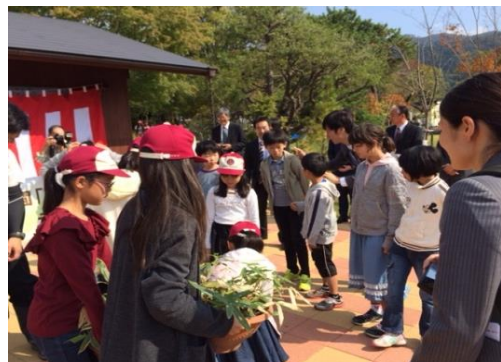
↑高倉小が育てたチマキザサを引き継ぐ花背小中の子供たち