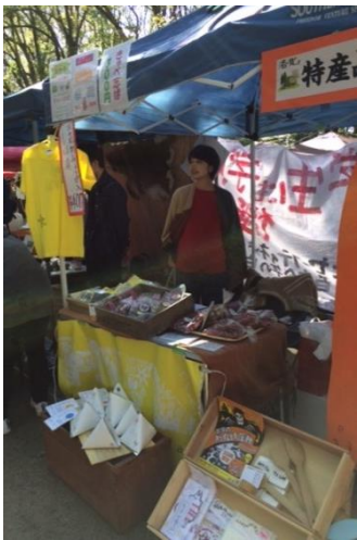
↑左北山間の物品が並ぶブース 花背ワンダーランドで出店してくれた方々も応援に！

十月二十八日、左京区下鴨神社の糺の森にて、『糺の森ワンダーマーケット』が開催されました。このイベントは『左京ワンダーランド』という大きな枠組の中の一つで、八月に行われた花背ワンダーランドの姉妹イベントです。花背ワンダーランドでもたくさんのご協力を頂いた恩返しも兼ねて花背物産店を出店。地元の品々を売ってきました。参道の真ん中で素足でダンスする人たちや、相撲