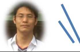
金井 (小野郷・中川・雲ヶ畑)