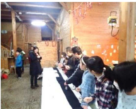
ハンドベルを演奏する子供たち

会の最後にはサンタさんからのクリスマスプレゼントもあり、子供たちはもちろん参加された地域の皆さんにとっても心温まる素敵な一日となりました。