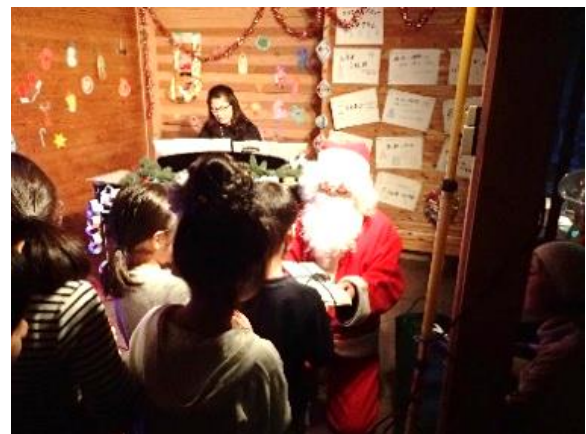
サンタさんからのプレゼント