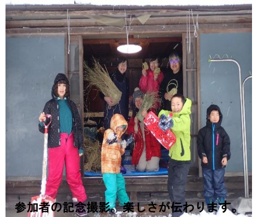
参加者の記念撮影。楽しさが伝わります。

また、一緒に遊びに来ていた子供達は降り積もった雪でカマクラ作りなど雪遊びと、みんなが楽しい時間を過ごしました。