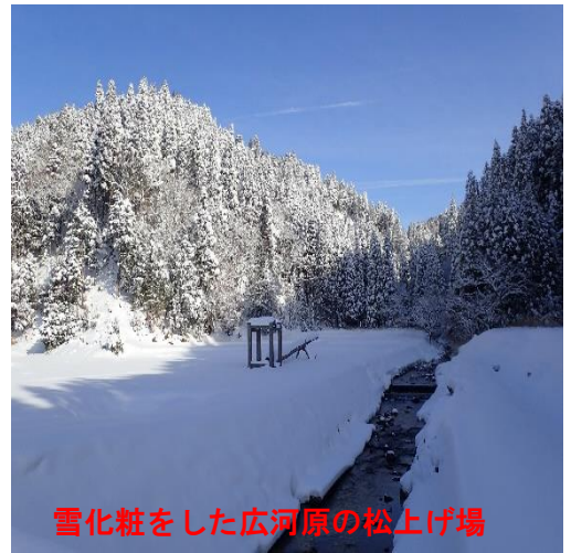
雪化粧をした広河原の松上げ場